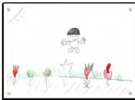
小学生が描いた食べ物の絵

ここに、ある小学校の5年生が描いた食べ物の絵があります。この絵には、野菜や果物が地面から“にょっこり”と生えています。もちろん、こんなふうに見える野菜や果物は存在しませんし、この絵だけをもって我が国の現状が反映されているとは言い切れません。ただ、この絵からは、「食」と「農」の距離が遠くなり、さらには「食」への関心が薄くなっていることがうかがえるのではないのでしょうか。