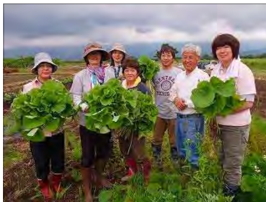
富山市 ㈱「エコロの森」 なんと農園倶楽部より (右から2番目の方がサポーター)

農作物の栽培等に関しては、一定の知識と技術が不可欠です。書物等で一定の知識を得ることは出来ますが、それだけでは上手くいかないものです。上手く栽培等をしていくには、土地や各地域の気候、土壌等に応じたコツのようなものが要るものですが、こうしたコツは、専門的な知識や経験を持った方から現場で教えてもらうことが一番です。