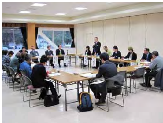
平成 22 年 3 月 教育ファーム交流会 in いしかわより

22年3月に石川県、12月に新潟県、平成23年2月に富山県、3月に福井県で交流会を開催し、意見交換や情報提供を通じ解決策の共有等に努めました。今後とも、交流の機会を増やしてネットワーク化を図り、相互に情報交換ができるよう取り組んでいくこととしています。