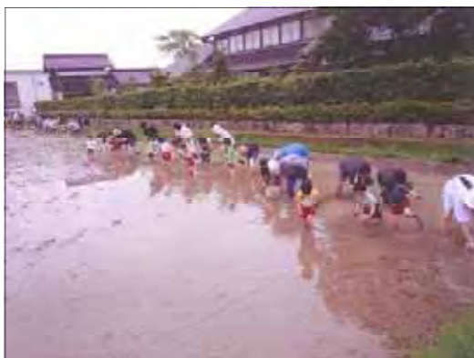
砺波市 たんぼにおえかき実行委員会 五鹿屋幼稚園児による田植え

協議会では、教育ファームを推進する取組主体、関係者やその活動を支援する者等の相互間の交流・連携を図るため、平成