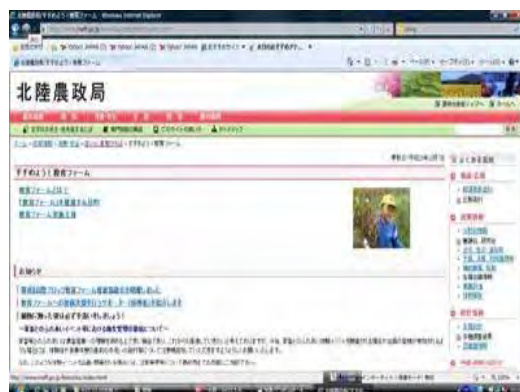
北陸農政局のHP 「すすめよう！教育ファーム」