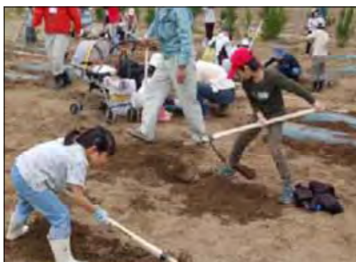
新潟市 新潟市教育ファーム推進協議会より

では、これから国民が「食への関心」を取り戻し、食に関して信頼できる情報に基づく適切な判断ができるようにするにはどうすれば良いのでしょうか。また、「我々の食生活が、自然の恩恵と様々な人の活動に支えられていることに感謝し、食べ物を大切にする心を養っていく」には、どうすれば良いのでしょうか。学校での教育や一般の方々への情報提供等で、「食べ物の知識や食べ物