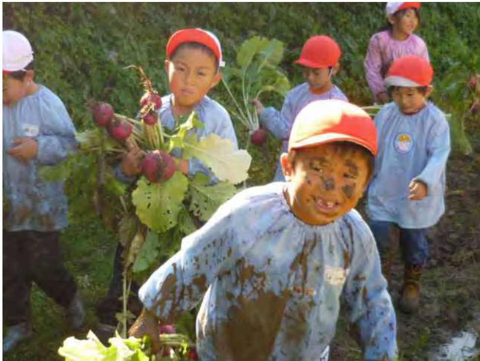
＝赤カブ収穫作業＝ 南砺市「みんなで農作業の日」in五箇山より