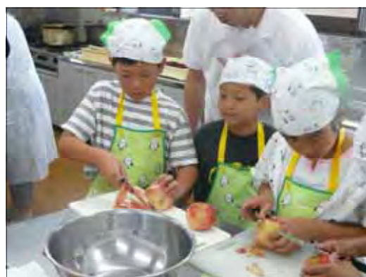
七尾市 わかばキッズクラブより

このことを通じて、「結い」を始めとした地域の特性を活かしながら、栄養バランスの取れた食、農、環境及び自給率向上の大切さ等に関する知識・技術の習得を進め、教育ファーム取組主体（以下「取組主体」という）間の連携を図り、教育ファームを継続して発展させていくこととしています。