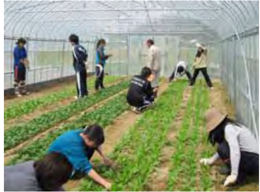
金沢大学生による農作業体験

今後は、金沢大学においては、こうした学生への農作業体験等を継続していただくとともに、管内の他の大学等へも同様の活動を普及していく必要があります。