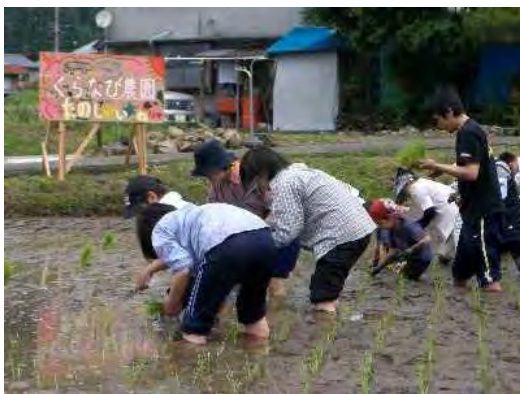
福井市 (社)ふくい・くらしの研究所より