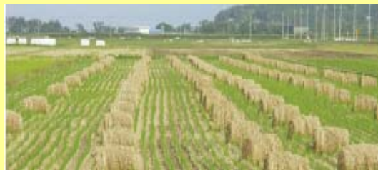
積み込み・運搬等