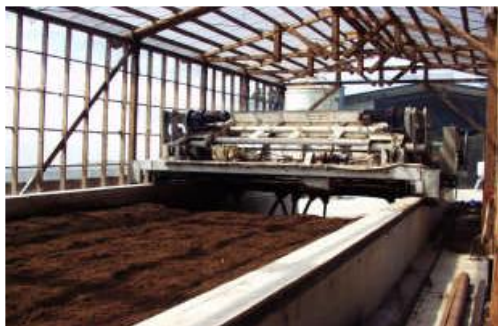
堆肥製造装置 (家畜排せつ物の強制発酵)