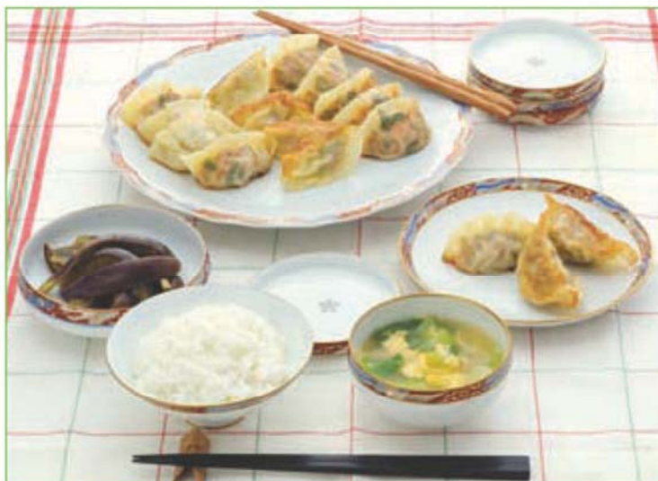
※写真のギョーザは2人前です。

自分で作って焼いて食べるギョーザは、子どもも大好き。お好みの具で、いっしょにたのしくオリジナルギョーザを作りましょう。