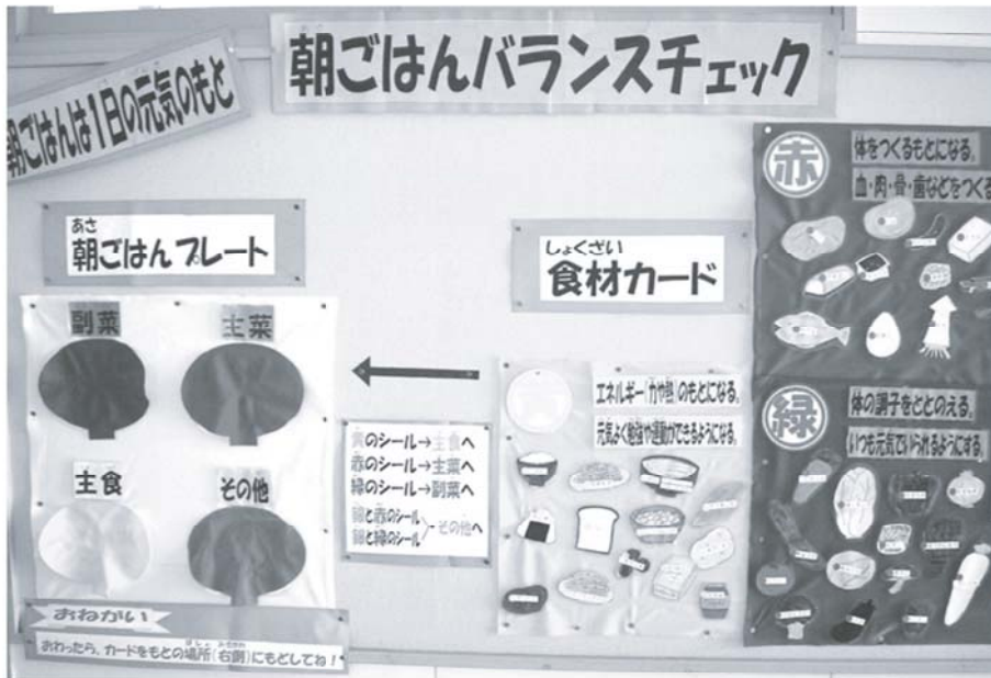
子どもたちの様子