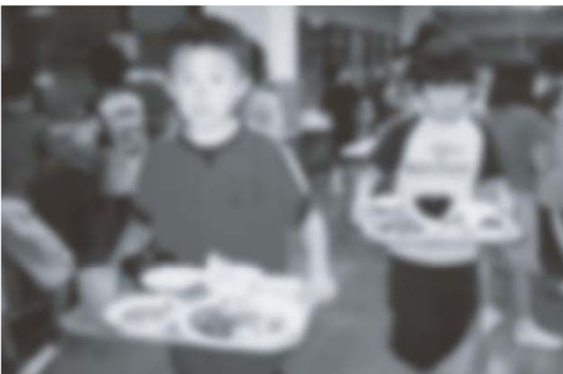
栄養バランスや自分の分量にあった食事を選ぶことができました。