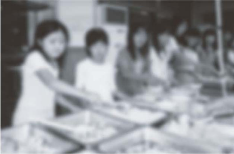
バイキング形式の多様な食事から…