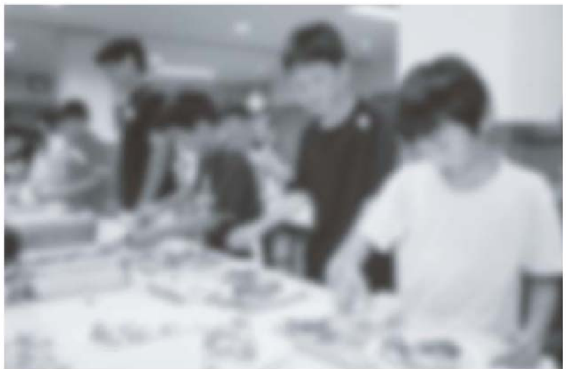
子どもたちは、自ら考えて…