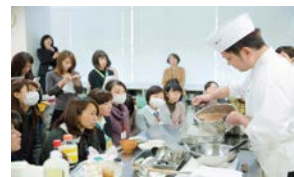
和食文化継承の中核的な人材育成