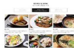
郷土料理の調査・データベースの作成・普及