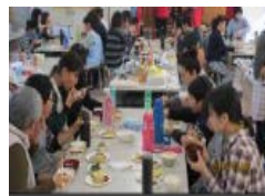
地域における共食の場の提供