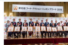
フード・アクション・ニッポン アワードで地域の優れた産品を表彰