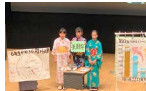
子供たちへの和食文化の普及のための実践的な研修