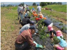
農林漁業体験機会の提供