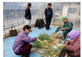
地産地消コーディネーターによる生産現場と学校給食側の調整

[お問い合わせ先] (1の事業) 消費・安全局消費者行政・食育課 (03-6744-1971) (2の事業) 食料産業局食文化・市場開拓課 (03-6744-7185)