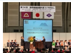
令和元年度食育推進全国大会 (山梨県甲府市)