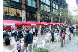
ジャパンハーベストによる国産農林水産物の魅力発信