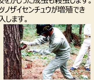
樹幹への薬剤注入

・ 薬剤散布（地上・空中散布）はマツノザイセンチュウを媒介するマツノマダラカミキリ成虫を直接殺虫するとともに、薬剤が染込んだマツの枝をかじった成虫も殺虫します。 ・ マツ樹体内に侵入するマツノザイセンチュウが増殖できないように樹幹に薬剤を注入します。