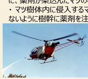
薬剤のヘリ空中散布