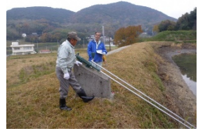
ため池の現地パトロール

【お問い合わせ先】 農村振興局水資源課 (03-3502-6246) 農村振興局防災課 (03-6744-2210)