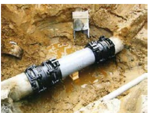
漏水防止のための整備