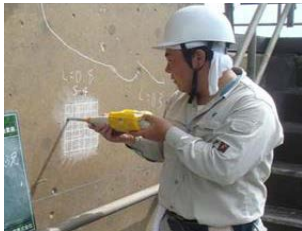
老朽化した施設の機能診断