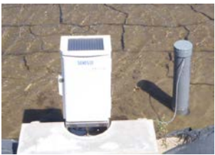
自動給水栓の導入