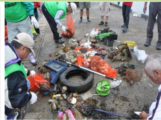
漂流漂着物の回収・処理