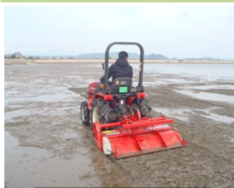
干潟の保全（干潟の耕うん）