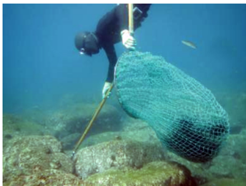
藻場の保全（ウコの駆除）