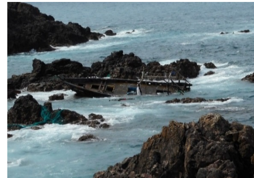
国境・水域の監視