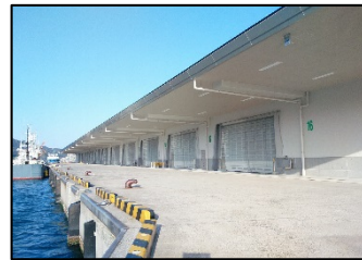
集出荷機能集約・強化と衛生管理に対応した岸壁と荷さばき所の一体整備