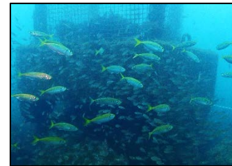
資源管理と連携した広域的な水産環境の整備