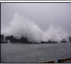
台風・低気圧災害に備えた漁港施設の耐浪化の推進