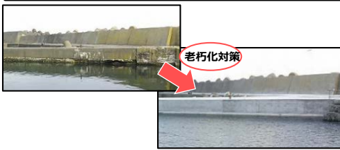
漁港施設の計画的な長寿命化対策の推進