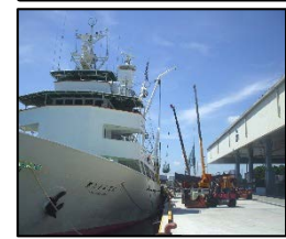
耐震強化岸壁等の施設の地震・津波対策