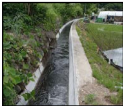
老朽化した用水路の整備・更新