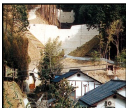
治山施設による山地災害の未然防止