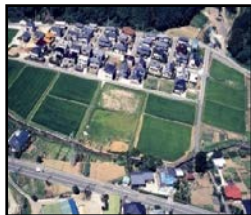
ほ場整備による農業生産性の向上と秩序ある土地利用の推進