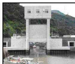
津波・高潮対策としての水門整備