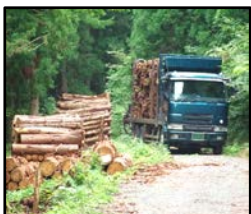
林道等の整備により効率的な間伐材等の搬出を実現