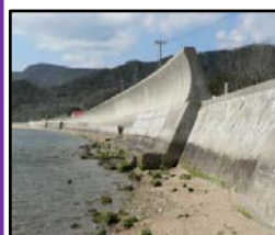
津波、高潮による被害を未然に防ぐため海岸堤防の整備を推進