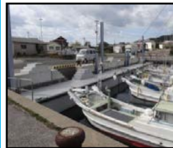
漁業作業の効率化と安全対策のための漁港整備（岸壁改良）