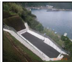
漁村における津波避難対策のための漁港整備（避難地、避難路の整備）