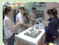
<マーケティング調査>