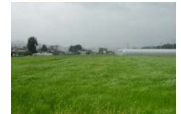
草地をリフレッシュ