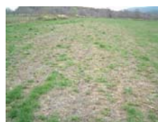
生産性の低下した草地