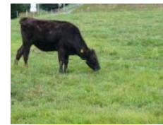
レンタカウ制度で放牧