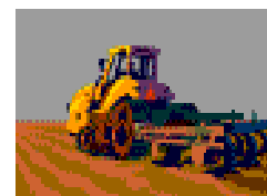
コントラクターへの支援を拡大