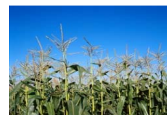
青刈りとうもろこしの作付拡大