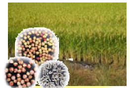
専用品種の種子確保