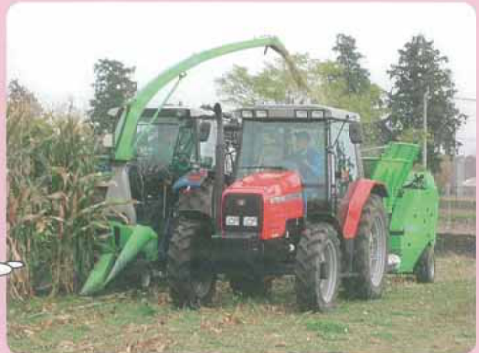
細断型ロールペーラによるトウモロコシの収穫作業