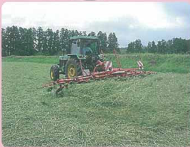
テッターによる飼料調製作業