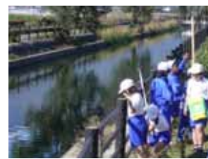
地元小学校の農業用水路の見学会