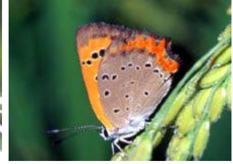
[ハニシジミ 前翅長13mm]