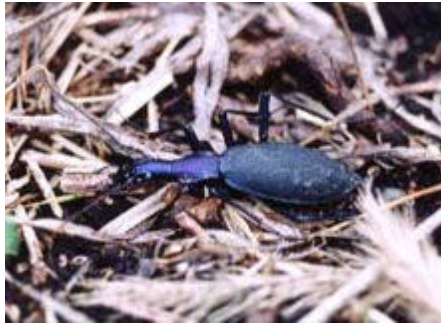
[マイマイカブリ 体長26-65mm]