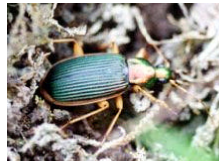
[オキヘリアオゴミシ 体長19.5-22mm]