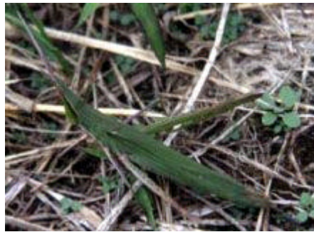
[ショウリヨウハツタ 体長45-82mm]