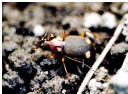
[キホシアオゴミシ 体長12-13mm]