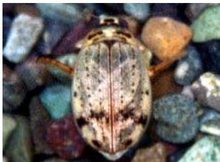
[ハイロゲンゴウ 体長9.8-16.5mm]