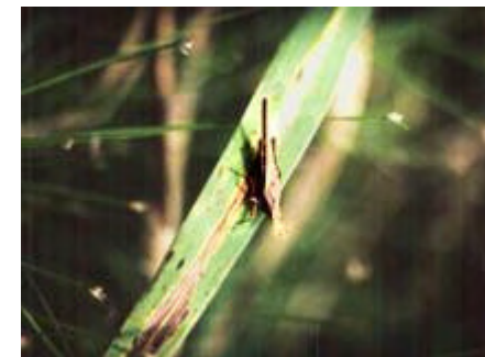
[トゲヒシバツタ 体長16-21mm]