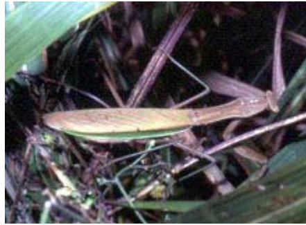
[オオカマキリ 体長70-95mm]