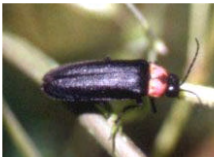
[ゲンジホタル 体長12-18mm]