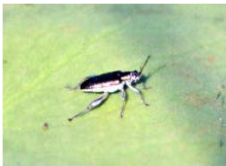
[イネクイハムシ 体長6-6.8mm]