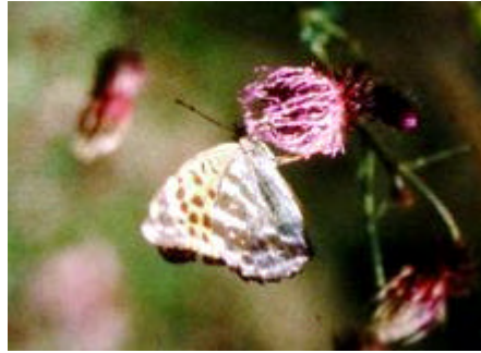
[ミドリヒヨウモン]