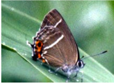
[ミドリシジミ 前翅長20mm]