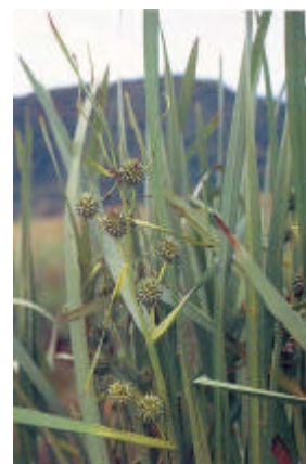
[ミクリ] 準絶滅危惧

出典 : 土地改良事業計画に関する生態系 (農村地域の水辺の生き物 調査報告書(H13.3) 農林水産省農村振興局土地改良企画課作成 日本水草図鑑(1994.7) 角野康郎 著