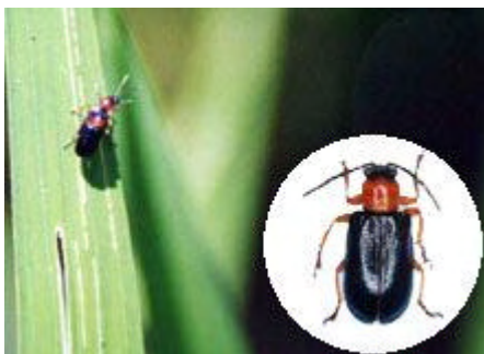
[イネビホソハムシ 体長3.9-4.5mm]