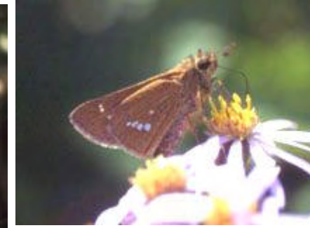
[イモンジセリ 前翅長15mm]