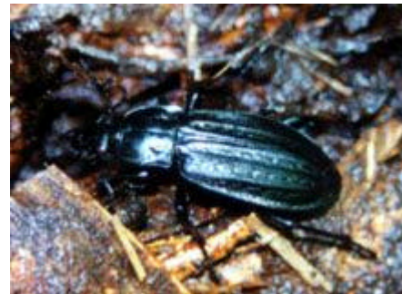
[マクオサムシ 体長25-32mm] 絶滅危惧 類