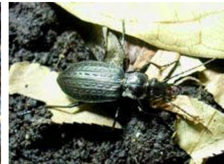
[アガネオサムシ 体長18-24mm]