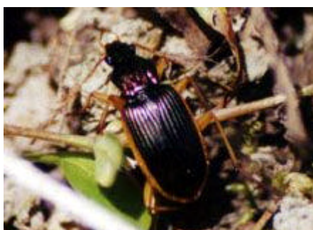
[コキヘリアオゴミシ 体長12.5-15mm]