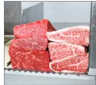
瘦肉和脂肪多的肉各自集中放置，切出來的肉片要麼只有瘦肉，要麼只有脂肪，商品化後的產品不均衡。