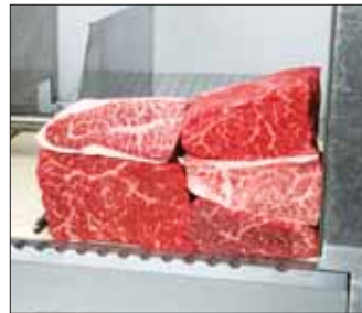
紅肉塊和脂肪較多的肉塊交錯放置。這樣在切塊時會比較均勻。