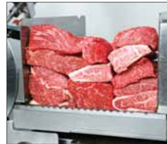
肉塊不能塞得過緊。另外，照片左上角的肉塊，筋纖維與刀成平行放置。這樣會使口感變差。(較硬)