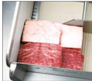
從上面看特別是最上面的正面是「商品的臉面」，所以要搭配美觀。