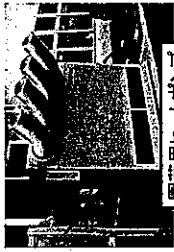
園芸用ヒートポンプ