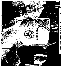
漁業用燃油タンク