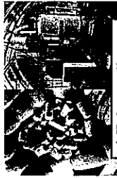
木質ペレット・ボイラー