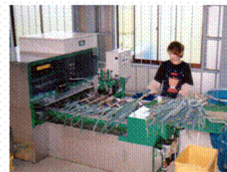
ねぎ調整ロボット