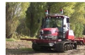
自動走行できるトラクター