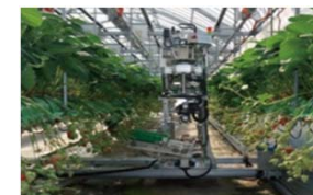
果菜類の無人収穫システム