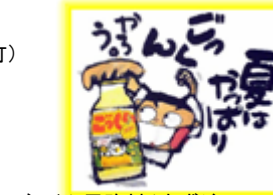
ごっくん馬路村(ゆずジュース) (高知県馬路村)