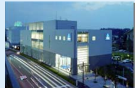
横浜テクノロジーセンター