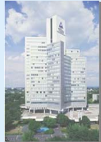
ドイツケルン本社