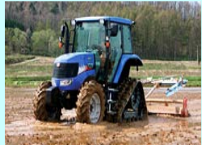
クローラー式トラクター (25馬力以上)