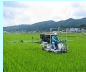
高精度肥料散布機