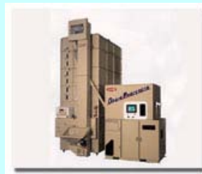
穀物遠赤外線乾燥機