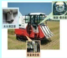
収量測定機能付き 自脱型コンバイン