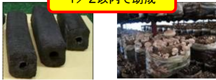
木炭や竹、きのこ等生産加工施設