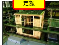
パネル・角材の強度の実証といった、地域材を利用した製品の開発

※上記の支援を受けるためには、各都道府県に設置される協議会に参画する必要があります。