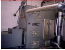
公共施設のボイラー

定額(標準的な単価) バイオマス利用量:5万円/m 3 (間伐材の利用量に応じた支援)