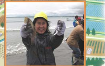
漁業体験で交流活動