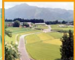
農業生産基盤の整備による農業への支援