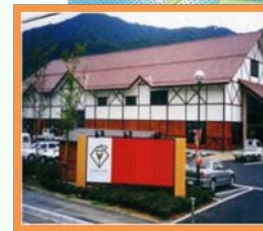
加工施設による地域産物の高付加価値化