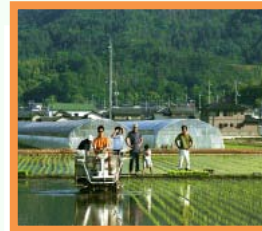
新規就農者の育成