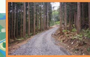
林道整備による林業の活性化