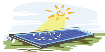
太陽光パネルを設置