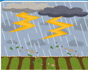
自然災害により、収量や品質が低下した場合