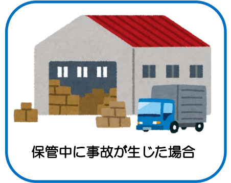
保管中に事故が生じた場合