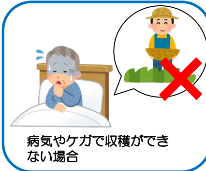
病気やケガで収穫ができない場合