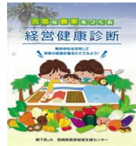
経営診断パンフレット