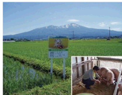
飼料用米と「こめ育ち豚」