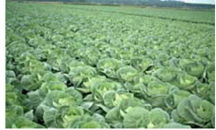
キャベツの栽培風景