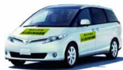
車両用ステッカーのイメージ