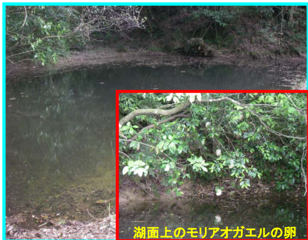
湖面上のモリアオガエルの卵