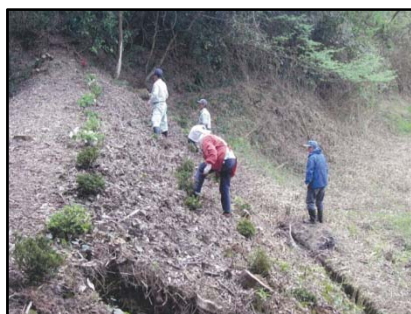
地域の人々による植栽