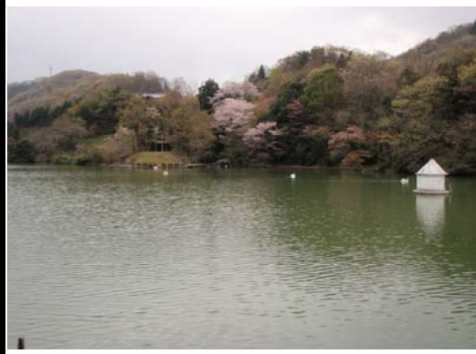
金清2号池の白鳥と桜