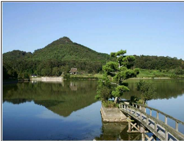
水面に映った逆さ有馬富士と弁財天