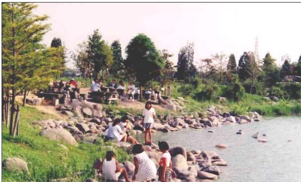
親水護岸では多くの人が水とふれあう。