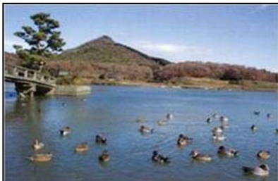
有馬富士と弁財天を背後に優雅に泳ぐカモ