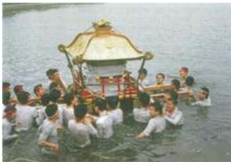
豊作を 願う池 山車