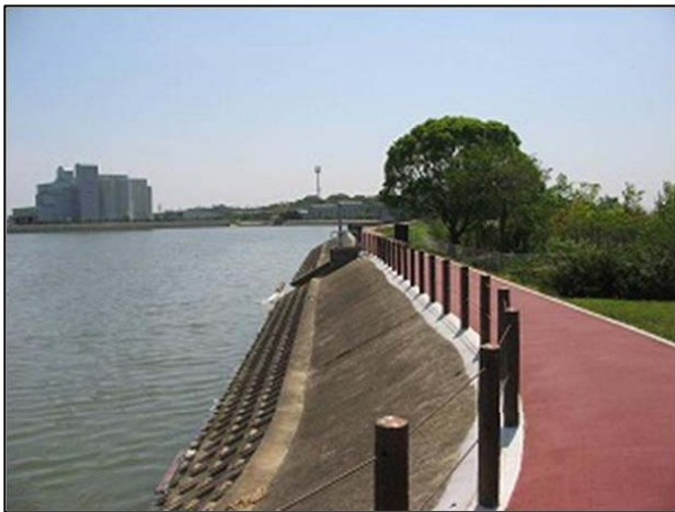
ウォーキングイベントの開催される遊歩道