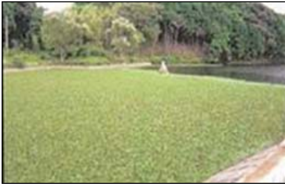
オオアカウキクサの大繁殖