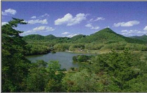
遠方からの福島大池と有馬富士