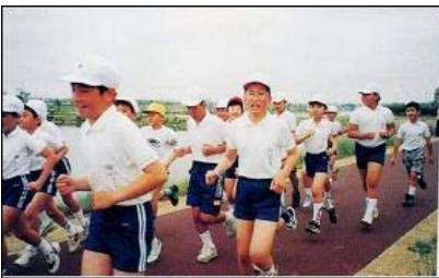
地域の小学校の マラソン大会