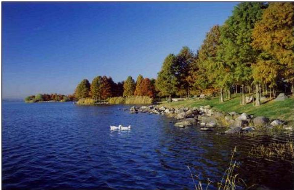
675年に造成された兵庫県最古のため池