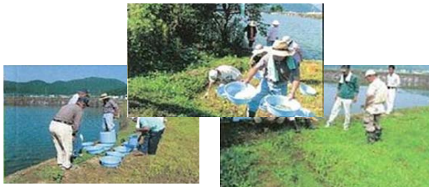
オオアカウキクサの再生