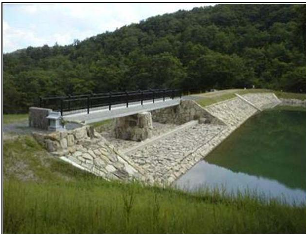
今田特産丹波石の余水吐