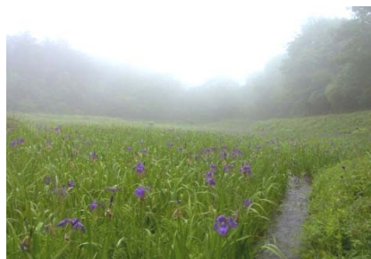
唐川湿原の カキツバタ 群落