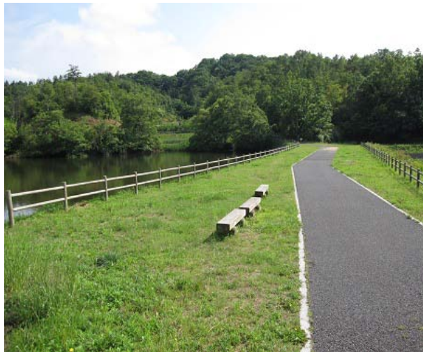
住民の憩いの場として活用されているため池周辺