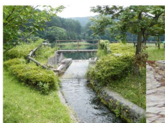
↑大成池から 下流の水田へ