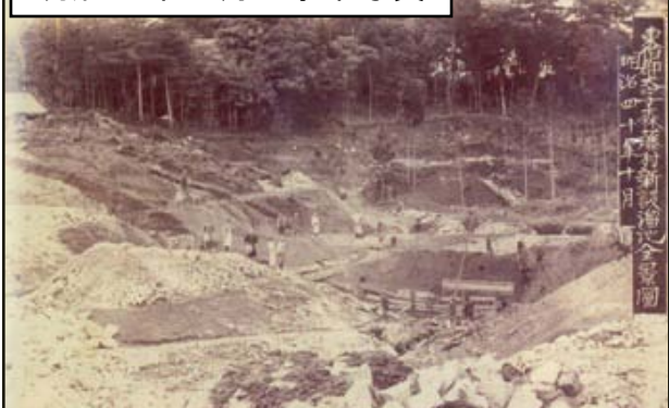
明治40年10月工事中写真