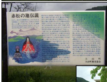
「お初伝説」 とお初を祭る祠