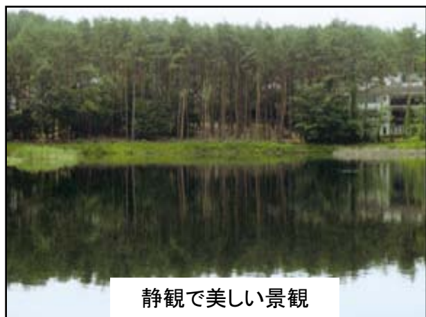
静観で美しい景観