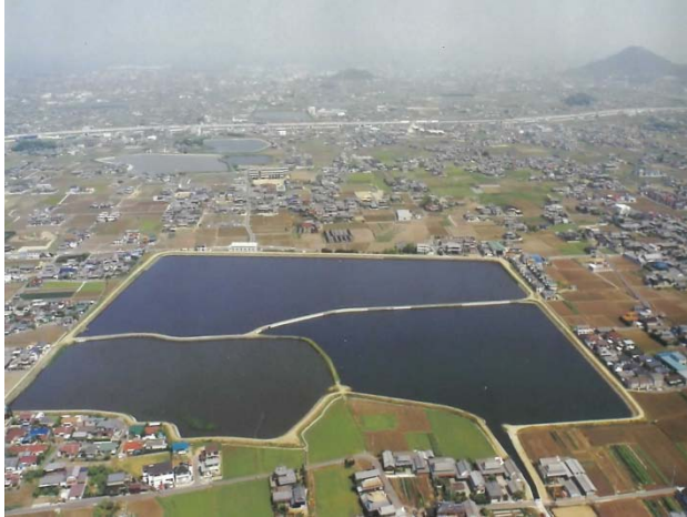
三つのため池が四角い形を造っている (宝幢寺下池、上池、仁池)