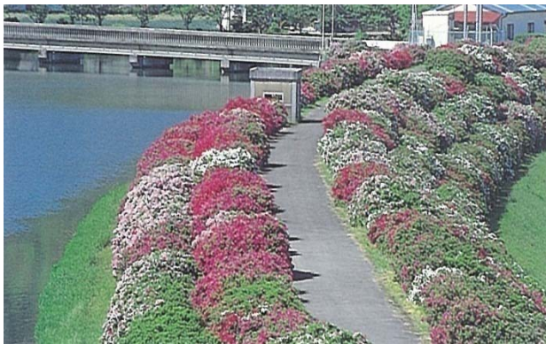
堤防に植栽されている見事なツツジ