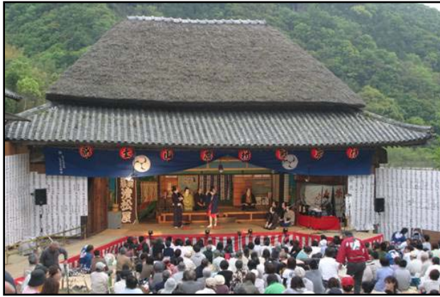
肥土山農村歌舞伎