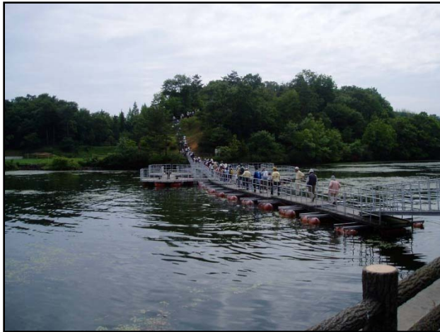
山大寺池の浮き栈橋