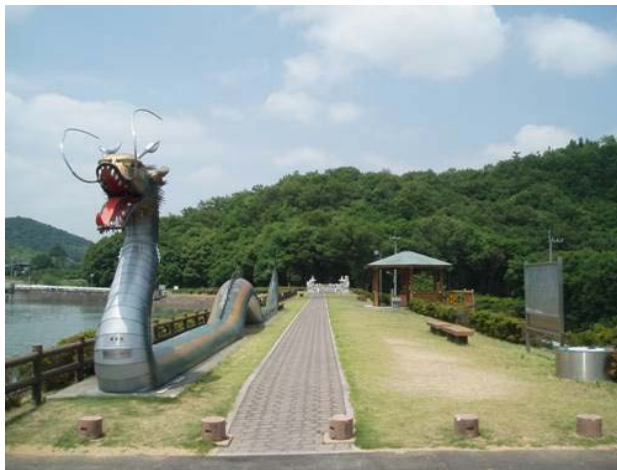
伝説にちなんだ「蛇の像」