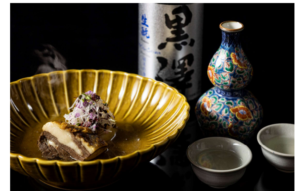
ジビエおでん茶屋