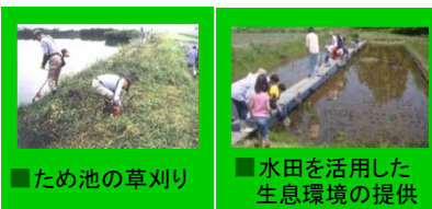
■ため池の草刈り ■水田を活用した生息環境の提供

地域においてより高度な取組を実践した場合に支援 活動水準に応じて 20万円/地区 40万円/地区