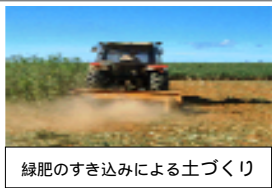
緑肥のすき込みによる土づくり