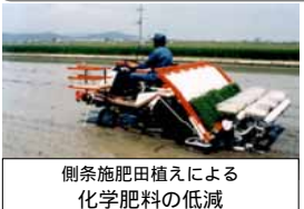
側条施肥田植えによる化学肥料の低減

そして、化学肥料と化学合成農薬の使用を大幅に減らす取組に地域でまとまりをもってチャレンジしてみましょう。