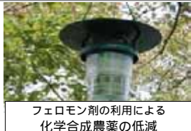
フェロモン剤の利用による化学合成農薬の低減