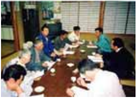
集落での話し合い