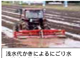
浅水代かきによるにがり水の流出の抑制