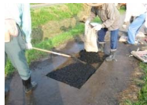
農道の補修 (対象組織が実施)

→①、②のいずれか小さい額が年交付金の上限額= 4,000,000円 (400万円)