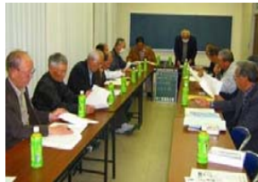
組織の中での話し合い

○年交付金の上限額 4,400円/10a × (250 × 100)a = 11,000,000円 (1,100万円)