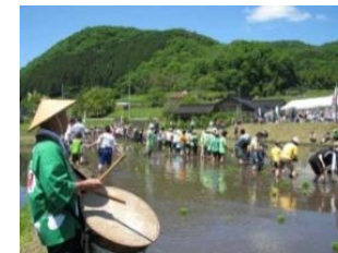
田植え祭の継承 【農村文化の伝承を通じた農村コミュニティの強化】