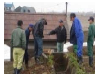
農業者による現地調査