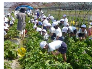
小学生の野菜栽培体験学習 【遊休農地の有効活用】