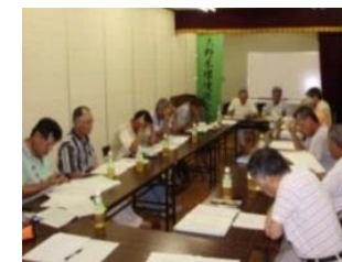
地域住民との意見交換