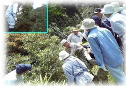
シャクナゲの花がら摘み