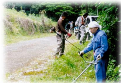
農道法面の草刈り