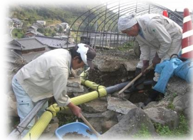
パイプラインの補修