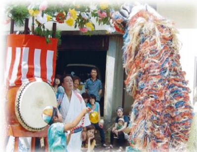
獅子舞の継承活動