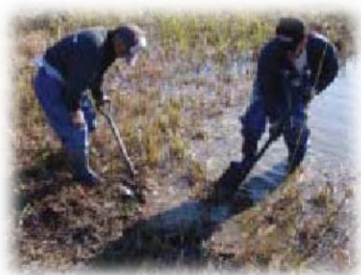
移植株の採取状況