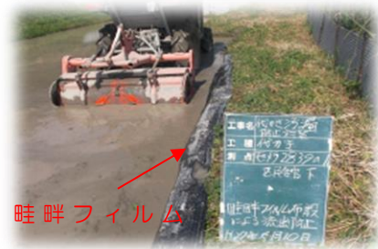
水田からの濁水の流出防止 (畦畔フィルムの布設)