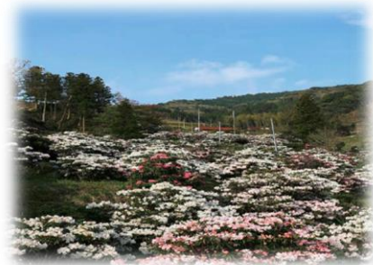
俵山しゃくなげ園 (見頃に時期には、約2万人の観光客が訪れます。)