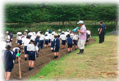
農業体験活動を通じた都市農村交流 (地区外の中学生を受け入れて ショウガの植え付け体験)