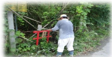
農道への鳥居設置 (不法投棄対策)