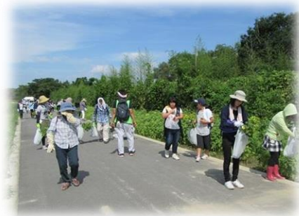
歩きながらゴミ拾いをする ウォーキングイベント (平成28年度の様子)