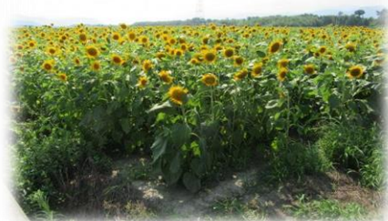
遊休農地へのヒマワリの植栽