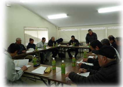
「ふるさと援農隊」の会議