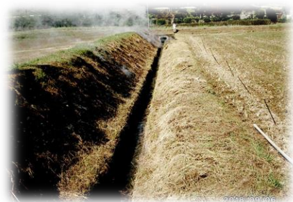
センチピードグラスの種子吹付 の前の雑草焼却