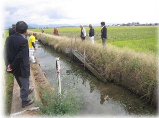
現地視察：水田魚道（2日目）