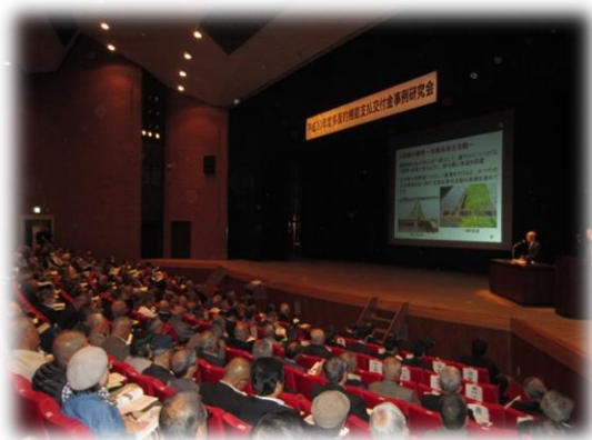
事例研究会のようす（初日）