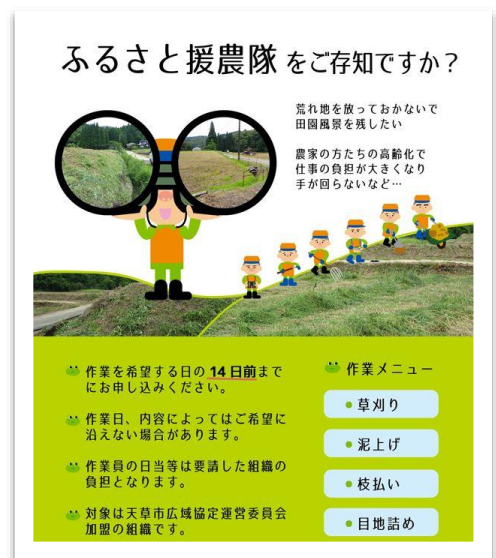
「ふるさと援農隊」のチラシ