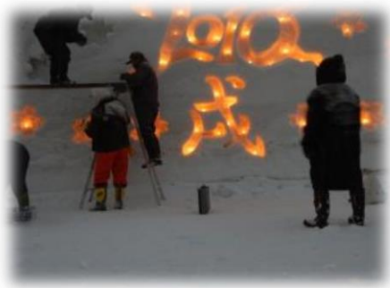
「雪あかり」での雪像の作成