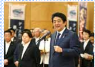
昨年度、首相官邸で開催された交流会の様子

農山漁村の持つ豊かな自然や食、産物など、埋もれていた資源の活用を行うことにより、都市と農村の交流、6次産業化、移住・定住の推進など農林水産業や地域の活力創造に繋がる取組について幅広く対象としています。