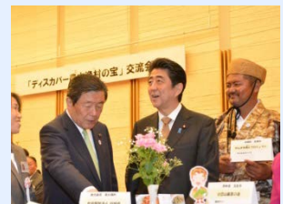
昨年度、首相官邸で開催された交流会の様子

農山漁村の持つ豊かな自然や食、産物など、埋もれていた資源の活用を行うことにより、都市と農村の交流、6次産業化、移住・定住の推進など農林水産業や地域の活力創造に繋がる取組について幅広く対象としています。