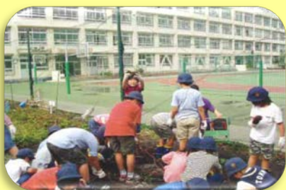
小学校隣接地の農園