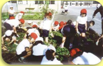
校庭の一角に作られた菜園