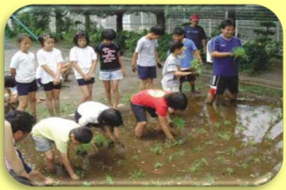
校内敷地を造成した人工水田