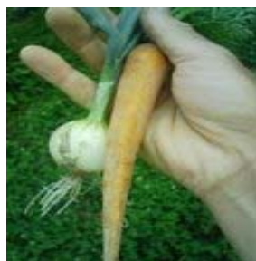
自然栽培にチャレンジ3年目の野菜