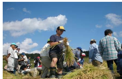
稲刈りの体験をする大学生