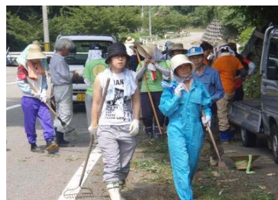
夏と冬に合宿し農業・農家体験をする大学生