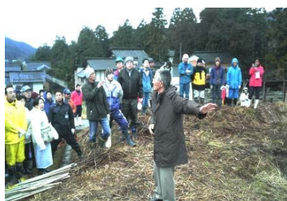
自然栽培実践塾を受講する農家