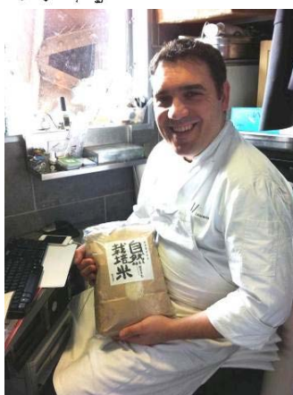
自然栽培米がパリ、高級レストラン、ジュエルベルグでデビュー