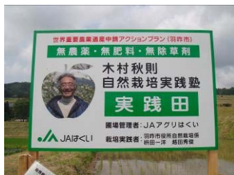
自然栽培米の実践田

また、都市部の大学生との交流事業や移住推進制度などにより、地域の賑わいを創出している。