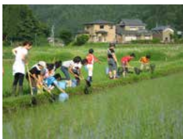
生き物観察会の開催