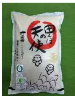
有機 JAS 米