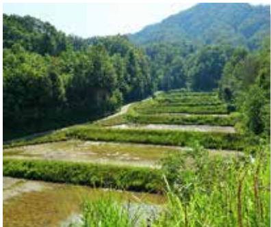
生きものがあふれる山間の水田

田んぼに自然の生態系を呼び戻したい、次世代の子供たちに安全安心な美味しい“お米”を届けたいという理念から、この思いに賛同する農業者が集まり「有機の会」を結成。