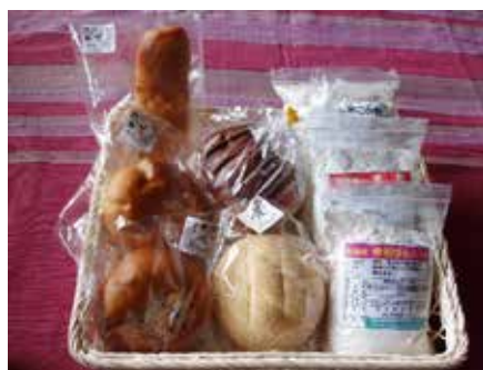
有機米 100% の米粉パン、クッキーなど