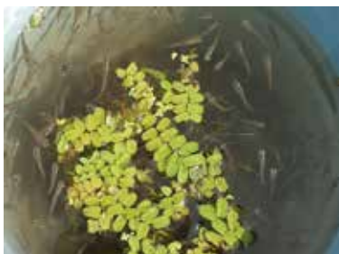
有機田で泳ぐメダカ (福井県絶滅危惧 類)

太陽の光を受けてキラキラと輝き、すべての生き物に愛を降り注ぐ「田んぼの天使」、蛍、メダカと共に育つ