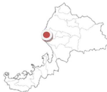
えちぜん 福井県越前町

平成 4 年から農薬と化学肥料を一切使用しない栽培を開始し、平成 12 年に有機 JAS 認証を取得している。