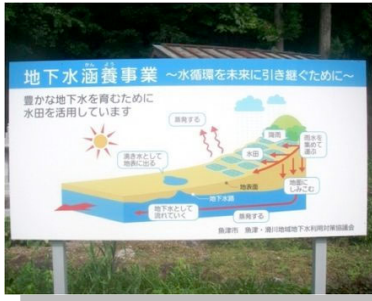
地下水かん養事業

片貝川流域は、源流から海までの水循環が1つのまちで完結し、その循環を一目で見渡すことができる世界でも稀な地域。