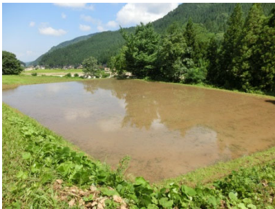
地下水かん養 休耕田を利用