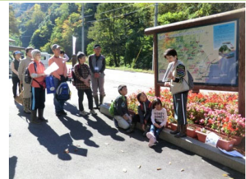
水の学び舎ツアー