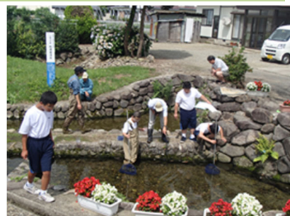
水環境学習の活動