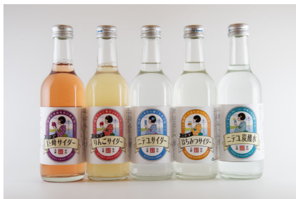
ニテコサイダー 新ラベル5種