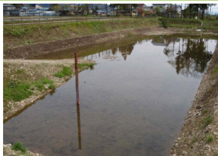
限りある水資源を守るための人工の地下水かん養池