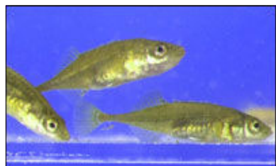
“ハリザッコ”ことイバラトミヨ

また、「あきた美郷づくり株式会社」では、町のレストランなどで特産のニテコサイダー、おからドーナツ、漬物などの製造、販売を行っている。 【令和2年度更新】