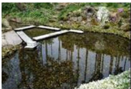
おだいどころしみず 御台所清水

奥羽山脈に源を発する扇状地のいたるところから清水が湧き出ている。六郷地区の住民は、昔から清水とともに生活している。清水は六郷の街を創り、産業を興し、文化を育んだ貴重な財産であり、この限りある水資源を守るため、人工かん養施設の設置や水源を守るためブナの植樹を行うなど町ぐるみで湧水を保全している。