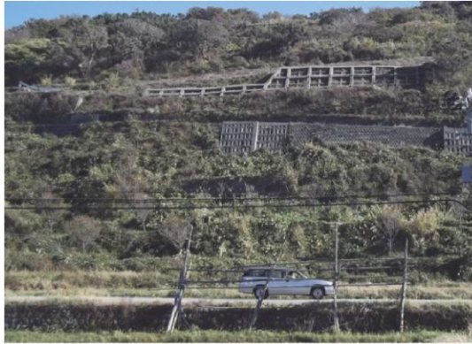
写真3 草刈り作業前後の現地状況（遠望） 8月（写真左上）には、草木に覆われてアンカー工が見えない状況であったが、草刈り作業の結果（写真左下：11月撮影）、斜面の下を通る主要地方道（両写真で車の停まっている道路）からもアンカー工の存在がはっきりと確認できるようになった。 これにより、地元住民から「ここが地すべり地であることを再認識した」という感想が得られた（写真右上は主要地方道と地元集落（右奥）。いずれからも当該アンカー工が望める。）。