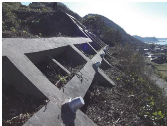
写真4 草刈り作業前後の現地状況 8月（写真左上）には草本に覆われていたが、草刈り作業後（写真左下：11月撮影）はアンカー工及びその周辺の点検が可能になった。 写真右上は地元多面的機能支払組合による草刈り作業の状況。